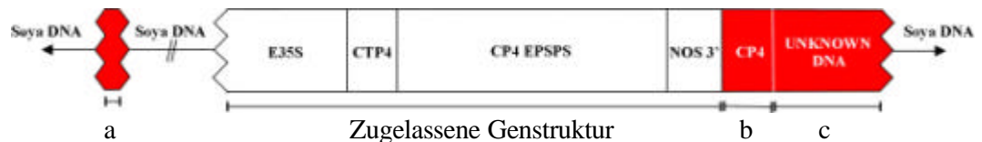
Abb. 2: Schematische Darstellung der neu eingeführten Erbinformation in RR-Soja von Monsanto. Mit a=72 Basenpaare langes Teilstück des Glyphosat-Toleranz-Gens (exakte Position ist unbekannt), b= 250 Basenpaare langes Teilstück des Glyphosat-Toleranz-Gens und c= 534 Basenpaare langes, unbekanntes DNA-Stück. Abkürzungen: E35S= Blumenkohl-Mosaik-Virus-Promoter, CTP4= Chloroplasten-Transport-Peptid-Sequenz aus Petunie, CP4 EPSPS= Herbizid-Toleranz-Gen aus Agrobacterium sp. vom Stamm CP4, NOS 3'= Terminator aus Nopalinsynthase-Gen.

2) Nicht zugelassene DNA-Struktur mit weiteren Teilstücken 13 und unbekannter DNA 14 (dunkel hinterlegt die nicht zugelassenen Bereiche):