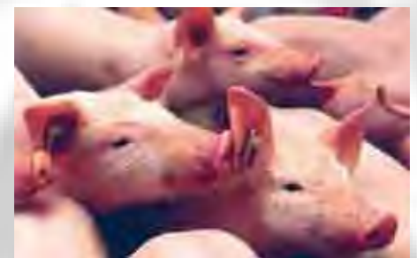
Ein Unternehmen der süddeutschen Hauptgenossenschaften

Mischfuttermittel und Lebensmittel beinhalten noch eine Reihe weiterer Inhaltsstoffe wie z. B. Vitamine, Enzyme und Aminosäuren. Ein Großteil dieser Zusatzstoffe ist bereits heute aus oder mit Hilfe von genmodifizierten Organismen erstellt. Aufgrund der aktuellen Gesetzgebung müssen diese Zusatzstoffe im Gegensatz zu den Nutzpflanzen häufig nicht als „gentechnisch verändert“ gekennzeichnet werden. Das Mikrobiologische Zentrum an der Bundesforschungsanstalt für Ernährung in Karlsruhe schätzt, dass etwa 70 % der Lebensmittel-Zutaten transgene Organismen enthalten. Die Produktion der verschiedensten Zusatz-